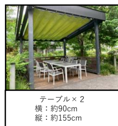
テーブル×2 横：約90cm 縦：約155cm