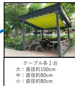
テーブル各1台 大：直径約100cm 中：直径約80cm 小：直径約80cm