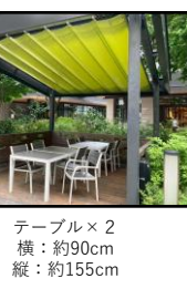
テーブル×2 横：約90cm 縦：約155cm